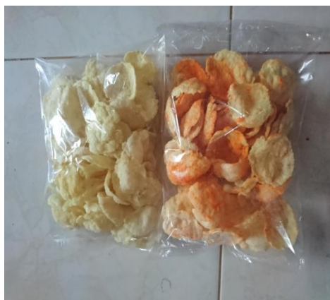
Gambar 1 Inovasi Produk Kerupuk Emping Mlinjo

Inovasi produk merupakan pengembangan ide dari suatu produk yang sudah ada sebelumnya agar memiliki nilai yang lebih berarti. Produk adalah segala sesuatu yang bisa ditawarkan dipasar agar mendapatkan perhatian, dibeli, dipakai, maupun dikonsumsi sehingga dapat memuaskan keinginan atau kebutuhan. 3 Produk UMKM kerupuk emping mlinjo yang merupakan hasil pemberdayaan dari ibu rumah tangga di Dusun Puhrejo masih menghasilkan kerupuk emping mlinjo yang mentah bukan produk yang dapat dimakan secara langsung atau produk jadi. Maka dari itu, inovasi UMKM pada kerupuk emping mlinjo di Dusun Puhrejo perlu dilakukan untuk mengembangkan produk kerupuk yang matang agar memiliki nilai jual yang berlipat-lipat. Semakin banyak peminat atau pembeli dari inovasi kerupuk emping mlinjo ini maka upaya pemberdayaan ibu rumah tangga tentunya juga semakin meningkat karena banyak dibutuhkan tangan-tangan terampil dari ibu rumah tangga untuk memproduksi kerupuk emping mlinjo yang lebih banyak.